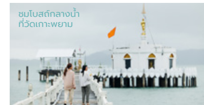
ชมโบสถ์กลางน้ำที่วัดเกาะพยาม