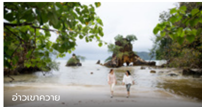
อ่าวเขาควาย