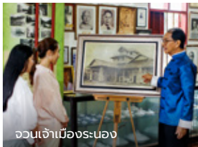
จวนเจ้าเมืองระนอง