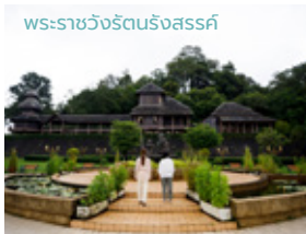
พระราชวังรัตนรังสรรค์