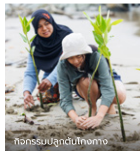
กิจกรรมปลูกต้นไม้ทาง