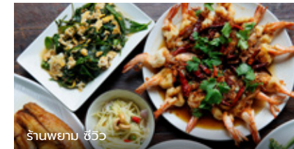
ร้านพยาม ชิววี่