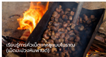
เรียนรู้การคว่เมล็ดกาหยูแบบโบราณ (เม็ดมะม่วงหิมพานต์)