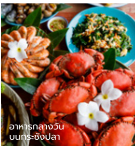
อาหารกลางวันบนกระซังปลา