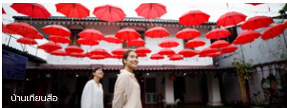
บ้านเทียนสือ