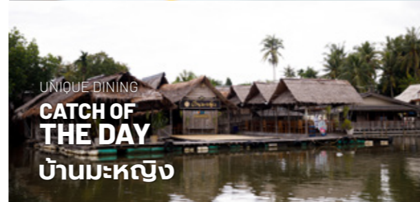
UNIQUE DINING CATCH OF THE DAY บ้านมะหะยิง