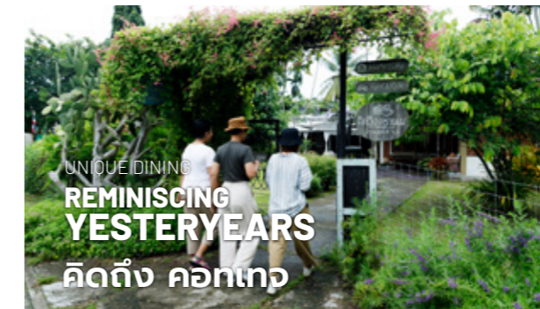
UNIQUE DINING REMINISCING YESTERYEARS คิดถึง คอกเทอ