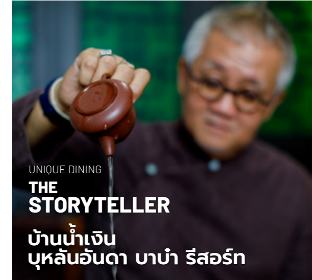
UNIQUE DINING THE STORYTELLER